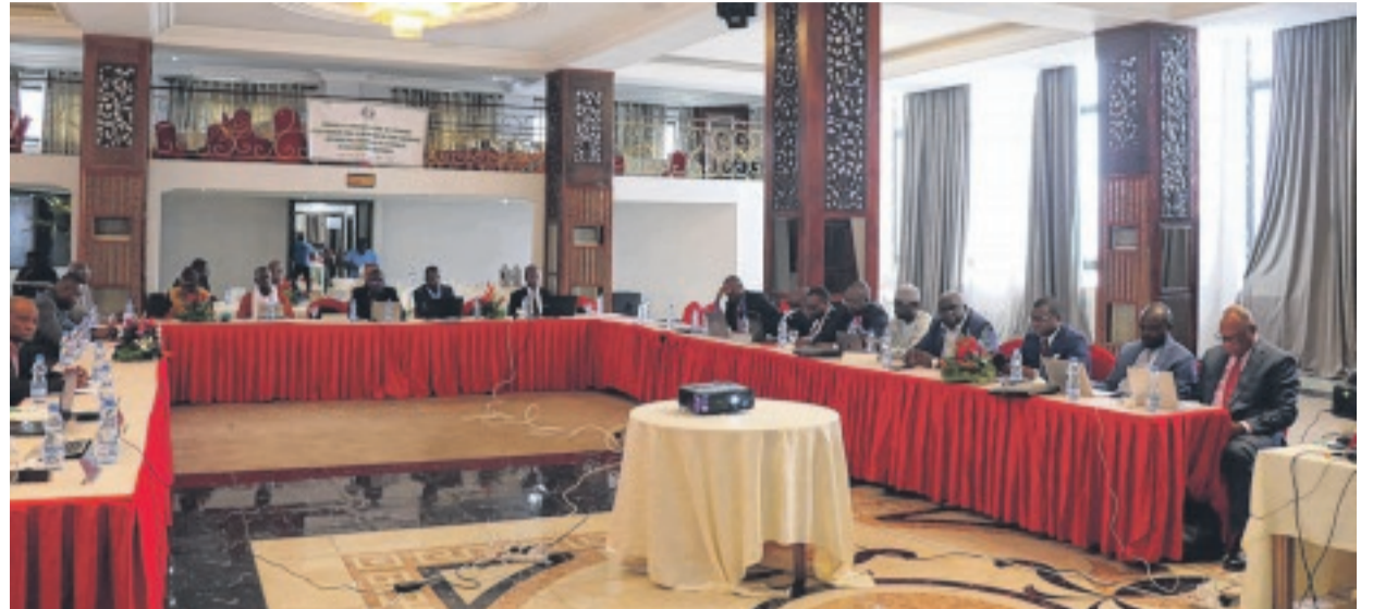
Les experts et les participants lors des travaux.

temps, les réformes préalables y relatives. "Après examen, les ministres du Copil du CRIB ont validé tous les textes, à l'exception de la République démocratique du Congo, qui a sollicité du Copil du CRIB un délai supplémentaire pour réunir les experts sectoriels de la RDC, afin d'examiner les possibilités d'harmoniser les textes validés avec la législation congolaise. Ainsi, les conclusions de cette réunion d'experts seront transmises, par voies de courrier, au secrétariat technique du CRIB", a indiqué le président du CRIB, Jules Doret Ndong. À cet effet, l'ensemble de textes réglementaires devra être intégré dans la Loi de finances de chaque pays membre. Dans cette logique, cette décision d'interdire l'exportation des grumes au 1er janvier 2023 entraînera inévitablement une baisse considérable des recettes fiscales forestières.